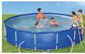
Auch Badevergnügen hat seinen Preis

Die Befüllung von privaten Schwimmbädern mit dem normalen Gartenwasserhahn dauert Stunden. Für den, der es schneller haben will, kann der Pool auch über einen Hydranten befüllt werden. Durch den Bauhof wird gegen eine Gebühr von 20.- € ein Standrohr zur Verfügung gestellt, das an einem Hydranten im Gehwegbereich angeschlossen wird. Für die entnommene Wassermenge fallen Wassergebühr und Kanalgebühr nach den gültigen Satzungen an. Nach