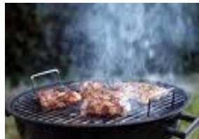
Ein Grill riecht und raucht

Grillpartys gehören zum Sommer. Wer erfreut sich nicht gern an einem schönen Stück Grillfleisch? Rauch, Geruchsbelästigung und Gesprächslärm lösen jedoch nicht immer nur Freude beim Nachbarn aus. Rechtlich kann dies zwar nicht eingeschränkt werden, allerdings sollte bei Grillpartys beachtet wer-