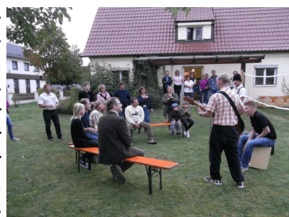
Der Jugendtreff im Regenbogenhaus in der Schlehenstraße

ein Kickerturnier veranstaltet und gemeinsam Plätzchen für die anschließende Weihnachtsfeier gebacken. An dieser Stelle möchten wir uns herzlich bei den Nachbarn für das Verständnis und allen Spendern für die großzügige Bereitstellung des Inventars bedanken! Die Öffnungszeiten des Jugend-