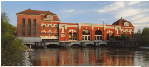
Das Lechmuseum in Langweid

Das Lechmuseum Bayern im historischen Wasserkraftwerk in Langweid ist eine multimediale Inszenierung des Lechs. Auf drei Ebenen des Wasserkraftwerkes und im Außenbereich werden der Lech und