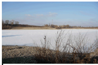
Der Gräbinger Baggersee

Aber Vorsicht: Mit Beginn der frostärmeren Zeit steigt die Gefahr auf den bisher zugefrorenen Seen! Deshalb die dringende Bitte an alle Schlittschuhläufer, Eishockeyspieler und alle anderen, die sich gern